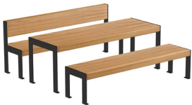
Picnic Table 101