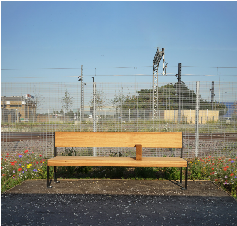
Bench 103 for Meridian Water Master Plan in Enfield, North London.